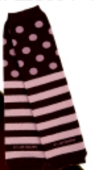
茶 x ピンク