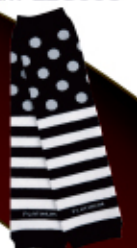
ドット 黒 x 白