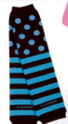
茶 x ブルー