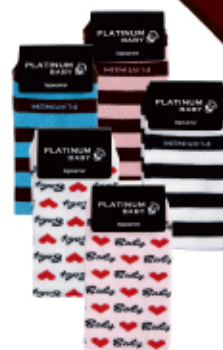
PLATINUM BABY レッグウォーマー 840 円 (税込み)

PLM-LEG001 PLM-LEG002 PLM-LEG003 PLM-LEG004 PLM-LEG005