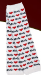
BABY ハート ホワイト