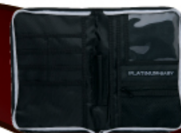
Lサイズ: 18.5×17×24cm 母子手帳の推奨サイズ: 約 20.5×13cm