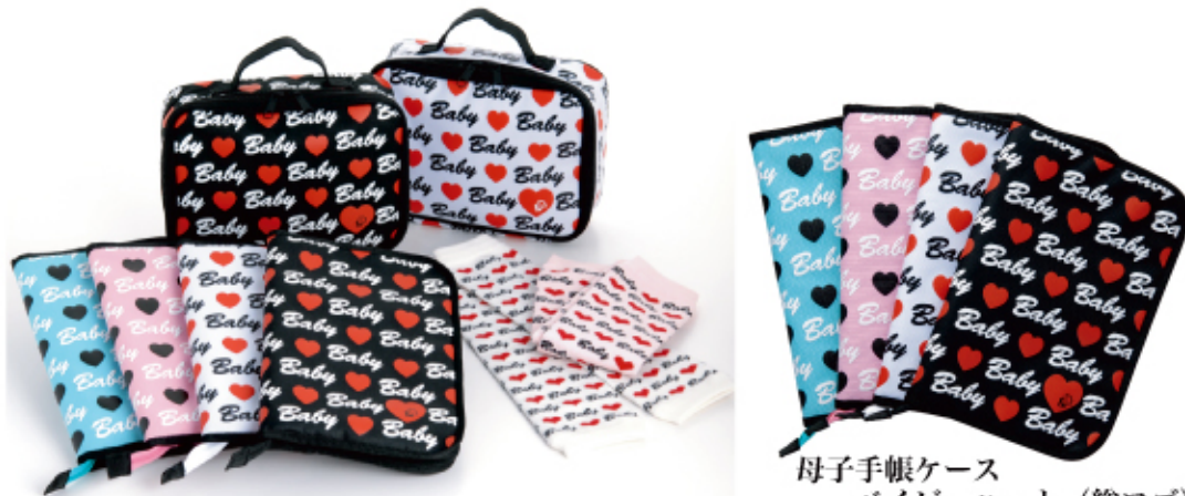
母子手帳ケース ベビーハート (総ロゴ)

PLM-003PML PLM-003BPL PLM-003WHL PLM-003BKL 2730 円 (税込み)