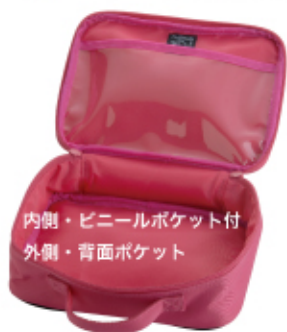
内側・ビニールポケット付 外側・背面ポケット