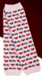
BABY ハート ピンク